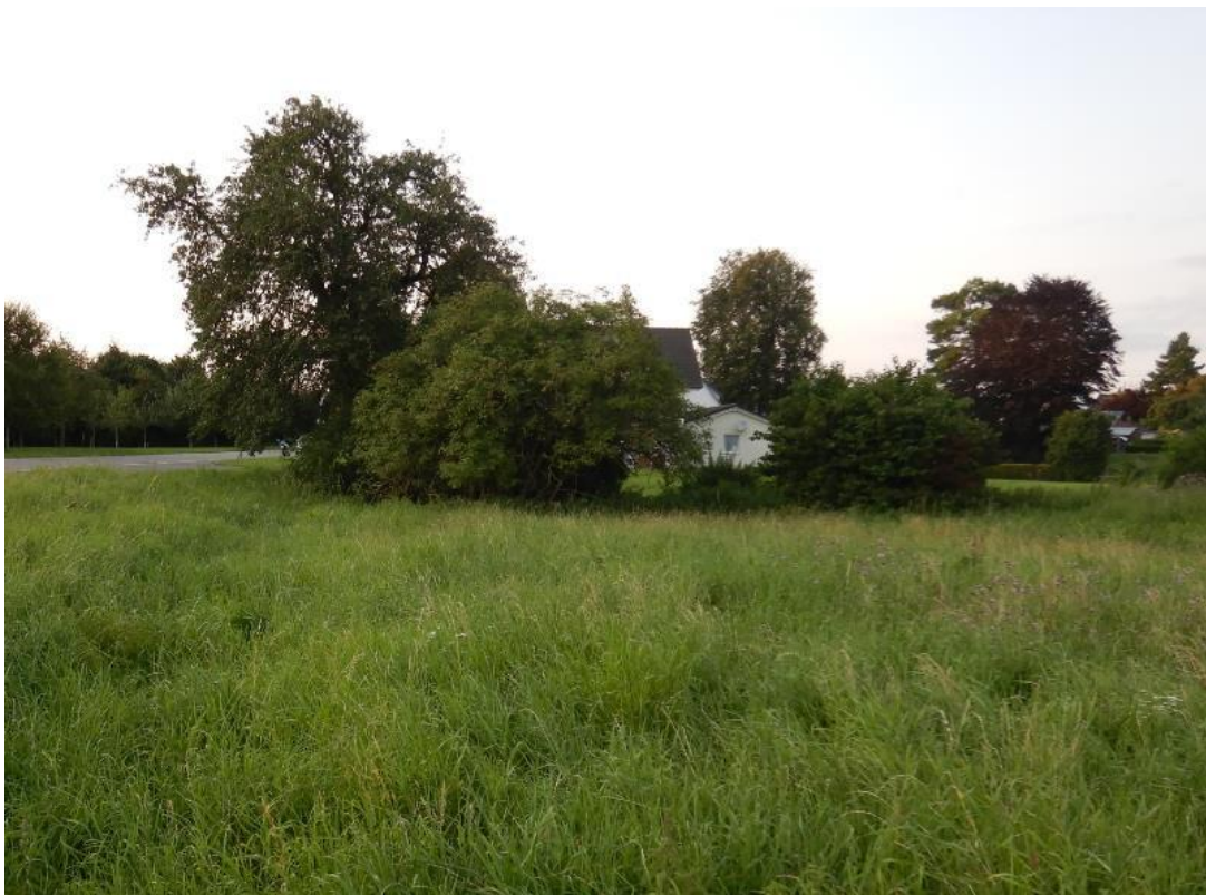
Gehölzgruppe im Nordwesten, Blick von Süden.