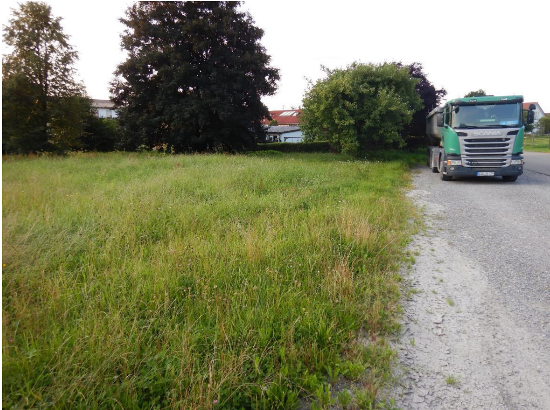
Gehölze und Schotterfläche im Nordosten der Vorhabensfläche, Blick nach Norden.