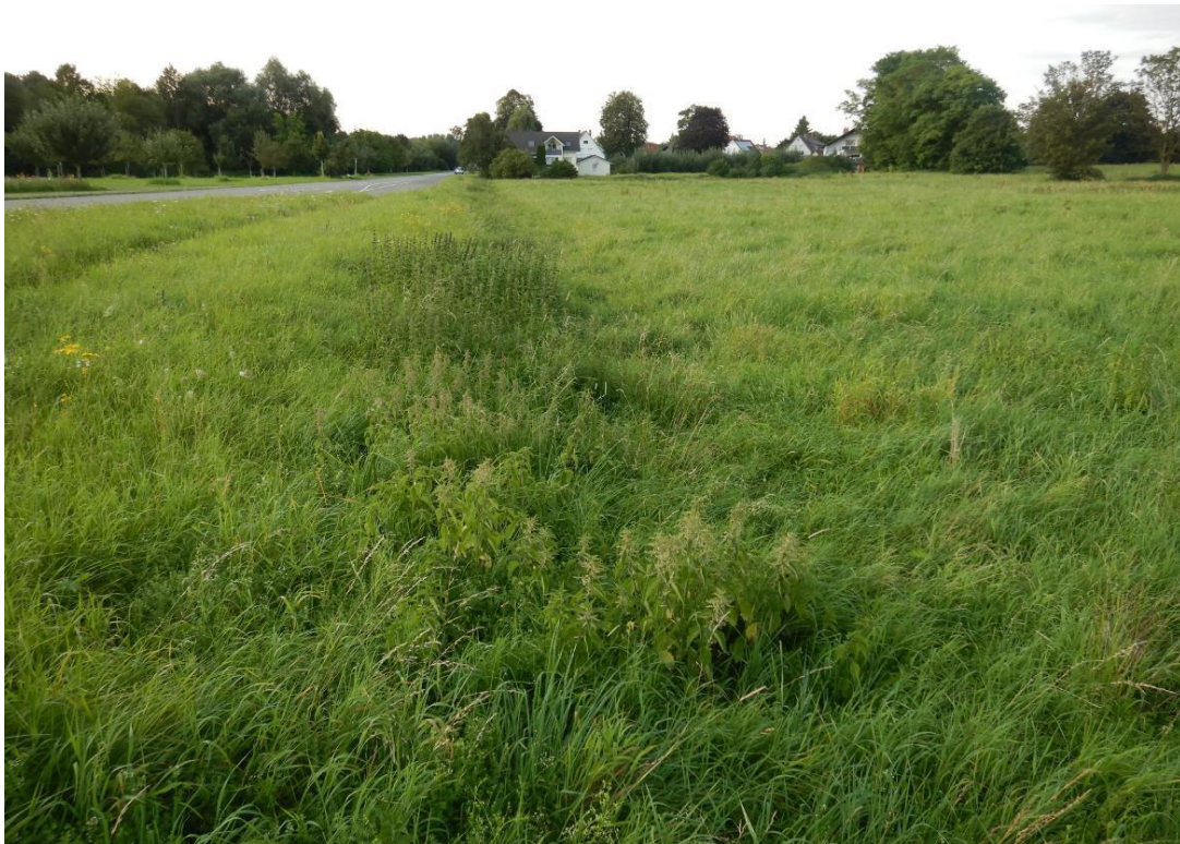
Vorhabensfläche, Blick von Südwesten.