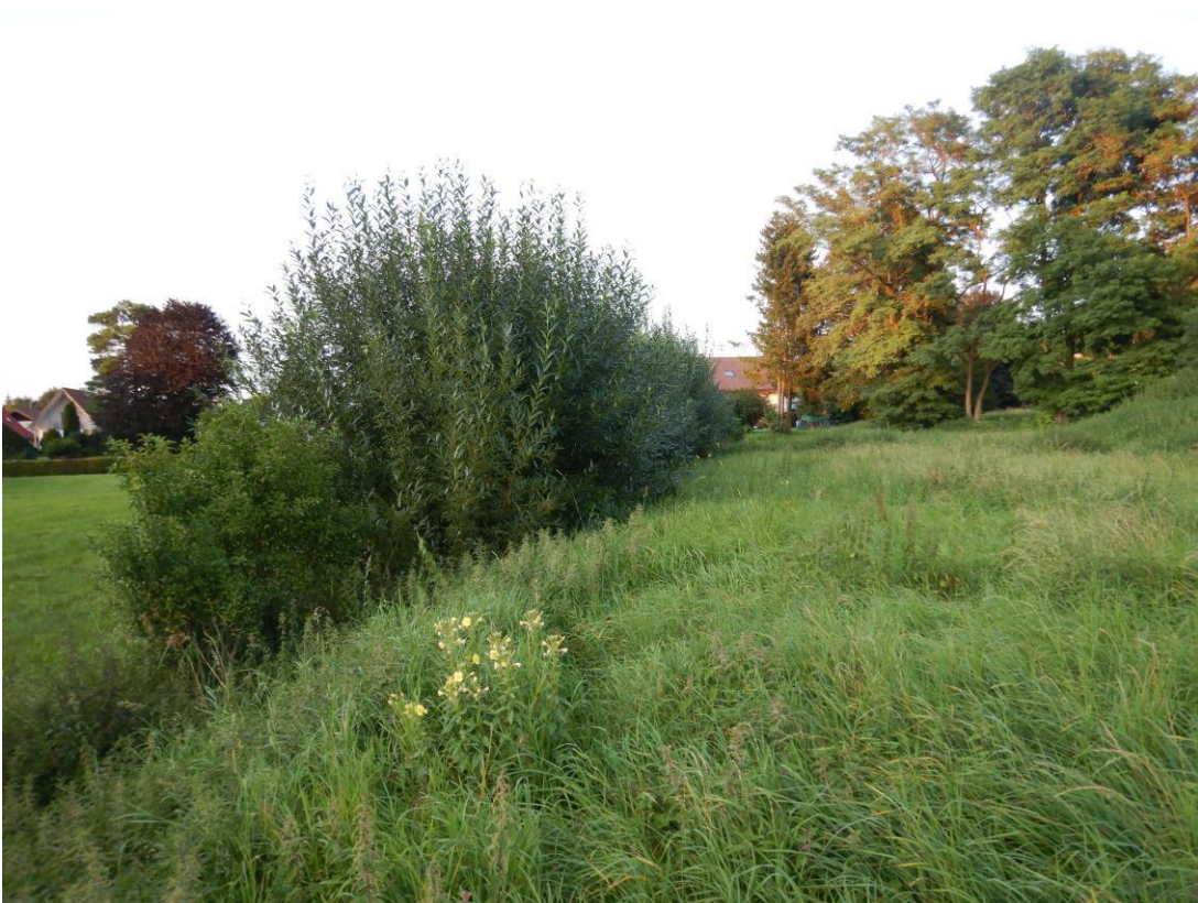
Schmaler Graben mit Weidengebüsch, nördlich außerhalb des Vorhabensgebiets. Gewöhnliche Nachtkerze im Vordergrund. Blick von Westen.