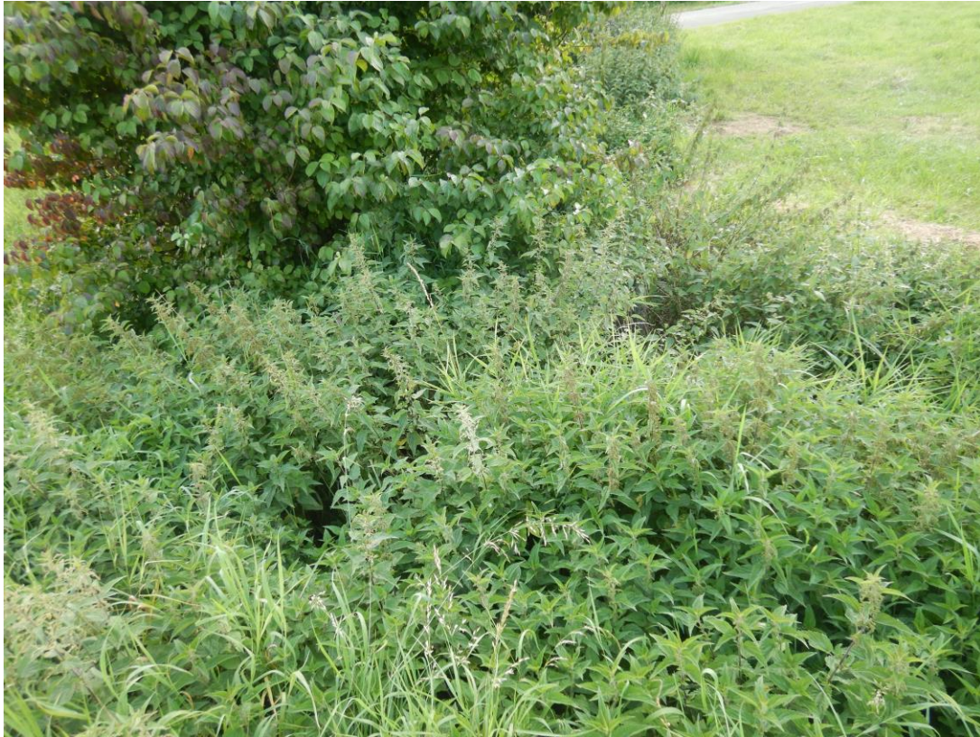
Stark zugewachsener Graben im Norden außerhalb des Plangebiets.