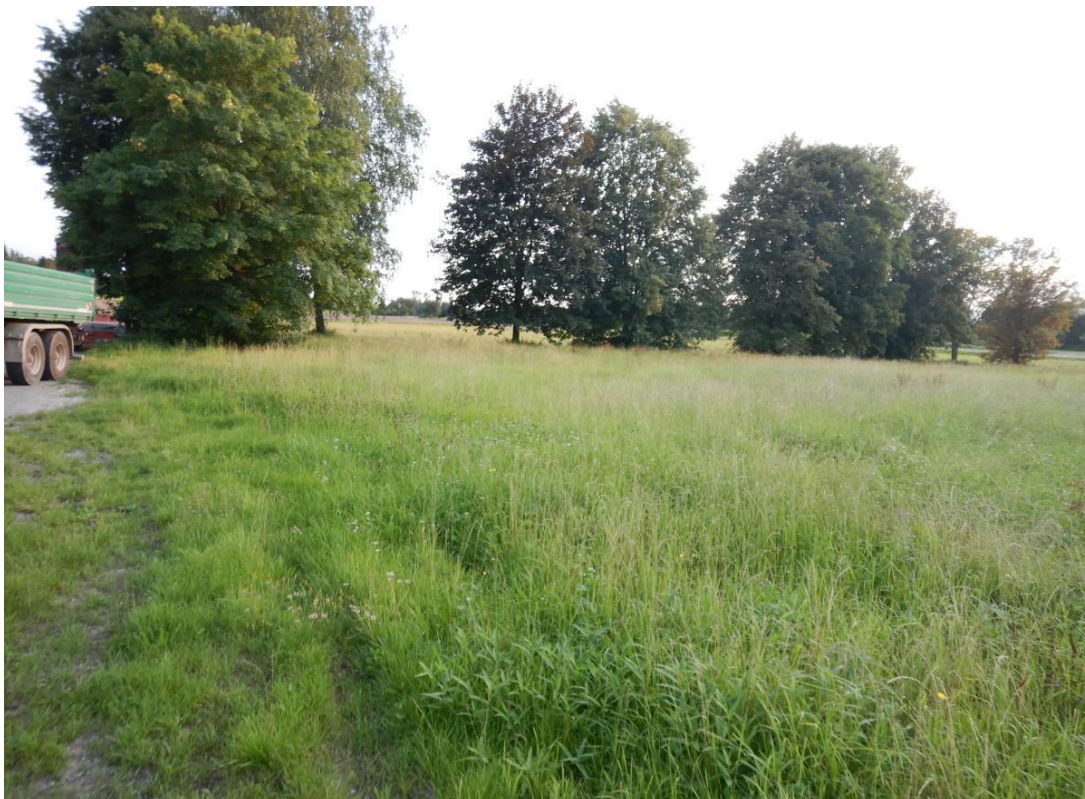
Baumgruppe in Ost-Westrichtung, Blick nach Süden.