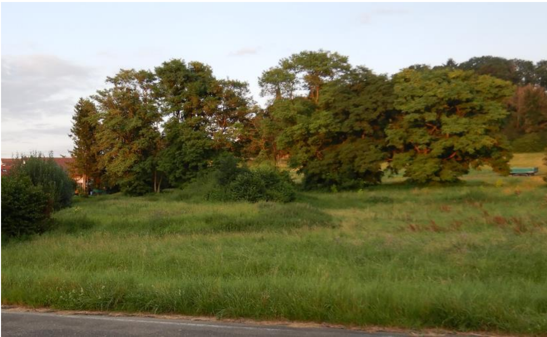
Baumreihe die in Nord-Südrichtung verläuft und die leicht erhöhte Fläche, Blick von Westen.